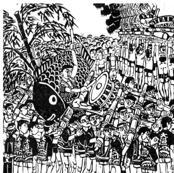
室津夏越祭 屋台練り（部分） 1990年代 たつの市教育委員会蔵