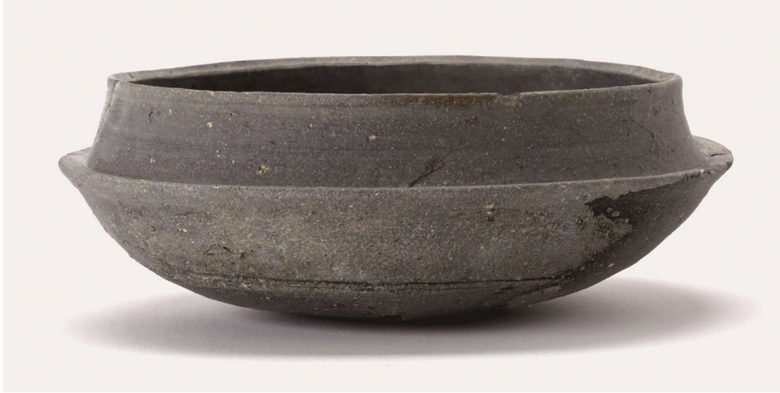
龍野町狐塚古墳採集須恵器（直径 14 cm、高さ 4.9 cm）