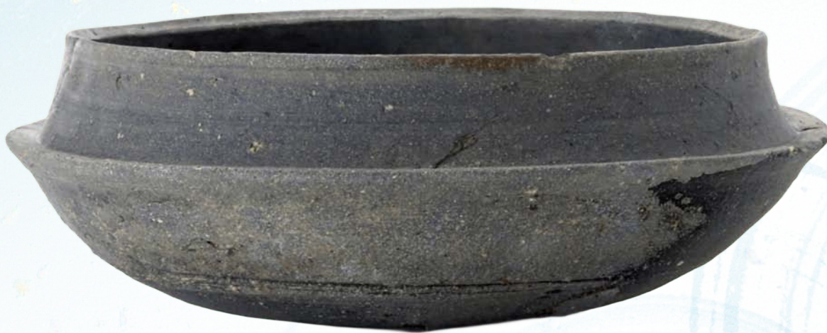
狐塚古墳採集 須恵器