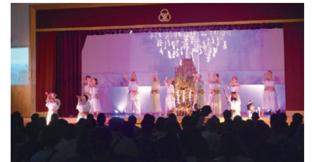
令和7年度 山の楽校 in 新宮 Tatsuno Dance Fes 2025 in SHINGU「響」の様子