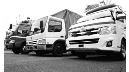
西はりま消防組合では、公用車3台を一般競争入札により売却します。

用(以降2年を1任期) 申込・問い合わせ先 自衛隊兵庫地方協力本部相生地域事務所(☎0791・23・2750)