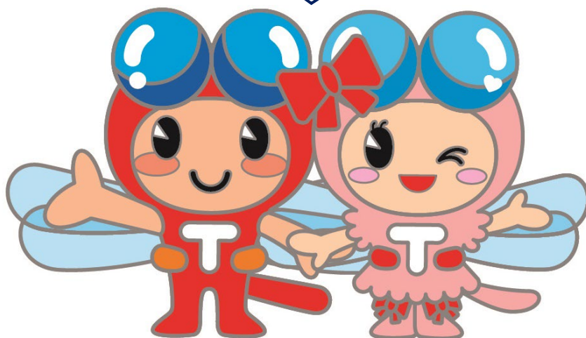
たつの市イメージキャラクター 赤とんぼくん あかねちゃん