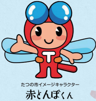
たつの市イメージキャラクター 赤とんぼくん