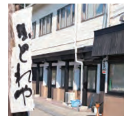
かとれや ☎ 079-322-0051

大自然がいっぱい、おいしいものいっぱいの新舞子では合宿にも最適です。73名様まで宿泊可能はうれしいかぎり。 宿泊・宴会【要予約】