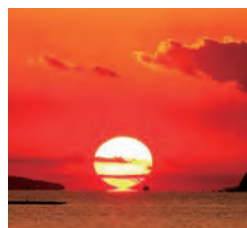
くつろぎの宿 田中屋 ☎ 079-322-3651

宿泊は120名様まで可能。海の幸を満喫の宴会はもちろん、会議や研修などできるホールも完備。 宿泊・宴会【要予約】