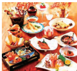
wad resort 千鳥亭 ☎ 079-322-2955

宿泊は1日3組のみの秘密にしておきたい「かくれ家」。天然物の美味しい鮮魚を存分に味わえます。丁寧なサービスが自慢です。 宿泊・宴会【要予約】