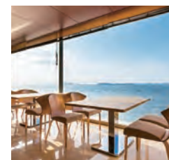
新舞子 ガーデンホテル ☎ 079-322-2231

素材そのもののおいしさを堪能できるのも旬の味覚を大切にしているからこそです。 宿泊・宴会【要予約】