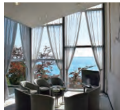
すばる坂 名田忠山荘 ☎ 079-324-0840

山荘というよりも「海を独り占めできる劇的空間」といったところ。しっとりほっこりしたいときには超おすすめです！ 宿泊・宴会【要予約】