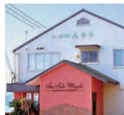
シーサイドみゆき ☎ 079-322-0207

豪快な磯料理から会席料理まで海の幸ならおまかせあれ。御津町特産のお土産もあります。 宿泊・宴会【要予約】