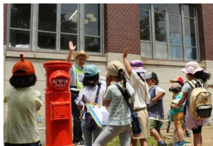
Kids たつの学重伝建地区探検