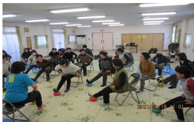
(健康体操とストレッチ教室)