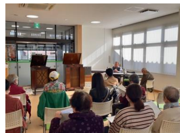
SPレコードコンサート