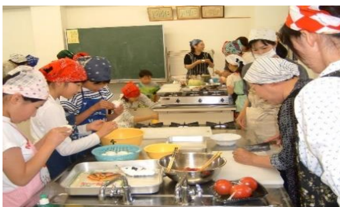
(親子でお料理作り)