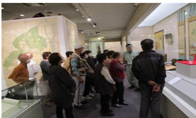
(龍野歴史文化資料館見学)