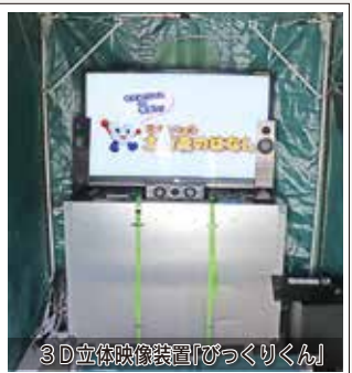
3D立体映像装置「びっくりくん」

小学校区ごとのハザードマップの展示のほか、(一社)兵庫県治山林道協会にご協力いただき、3D立体映像装置「びっくりくん」で土石流の再現映像の上映を行い、防災意識の向上を図りました。