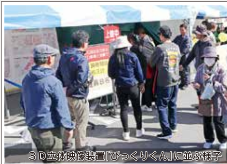
3D立体映像装置「びっくりくん」に並ぶ様子