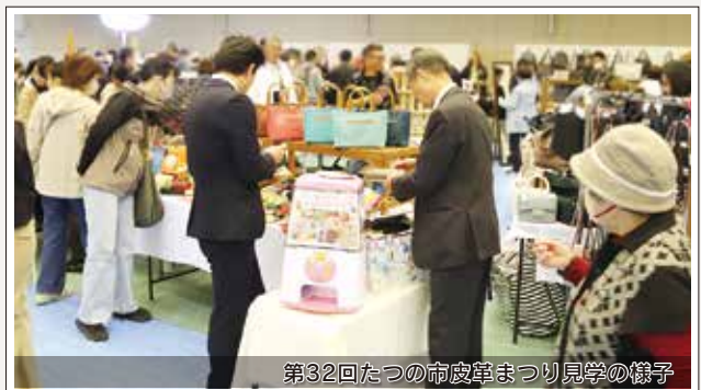
第32回たつの市皮革まつり見学の様子

安芸市とは、童謡を通じたまちづくりの縁により、合併前の平成元年から姉妹都市の交流を行い、2年に1度、交互に訪問をしています。本年は、安芸市議会の訪問を受け、市内の施設やイベントの見学等を行いました。