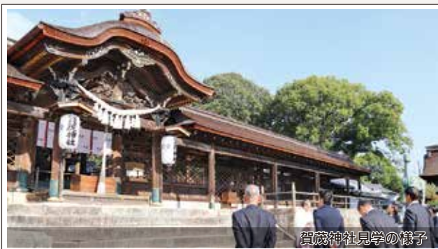
賀茂神社見学の様子