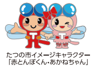
たつの市イメージキャラクター「赤とんぼくん・あかねちゃん」