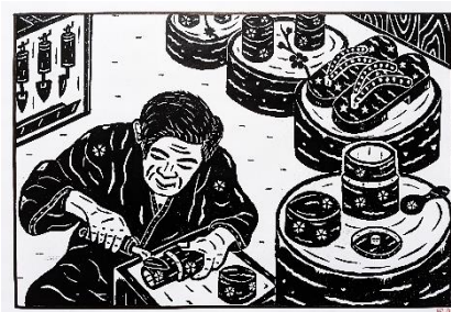
「桜樺細工 茶筒」赤木節雄 作