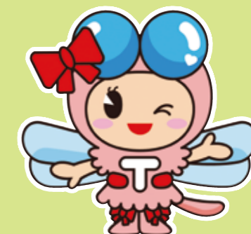
たつの市イメージキャラクター あかねちゃん