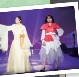
★レザートークショー チケット配布場所