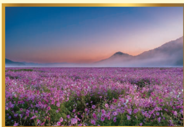
「コスモス畑の霧に煙る朝」