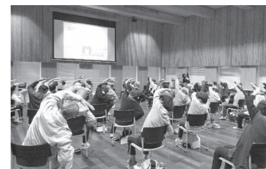
いきいき百歳体操の様子

いきいき百歳体操を継続し、体操の記録をする貯筋通帳を満了した方に、いきいき元気賞を授与しています。関連情報は25ページをご覧ください。