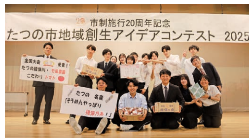
※昨年度の開催時の様子です。

大学生の柔軟な発想や創造力を生かした政策に込められた熱い想いに触れながら、「たつの市」の未来を一緒に考えてみませんか？