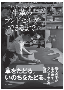
牛革のランドセルができるまで

本展では、日本一の皮革産地として知られるたつの市で生まれ育った上吉川さんが、畜産農家、食肉処理場、皮革工場、そして革製品を手がける工房を16年にわたり丹念に取材。思いを込めた人々の手によって「いのち」が皮から革へと形を変え、やがて靴やバッグ、そしてランドセルとなって子どもたちの毎日に寄り添うまでの「いのちの物語」を紡いだ作品約35点を展示します。