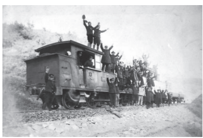
姫路～津山間開通記念写真

本年は、姫新線が開業して90年目を迎えます。これを記念し、霞城館では姫新線を走っていた蒸気機関車をテーマに企画展を開催します。