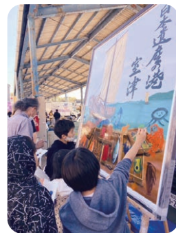
北前船交流イベント

歴史文化財課では、こうした貴重な歴史文化遺産を保存・活用し、地域の魅力向上とにぎわい創出につなげる取り組みを、関係団体等と連携して進めています。ぜひ室津を訪れ、歴史と文化が織りなす港町の魅力を体感してみてください。