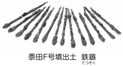
黍田F号墳出土 鉄鏃

本市が保管している考古資料のうち、普段展示していないものの中から、学芸員イチ押しポイントを選んで展示します。