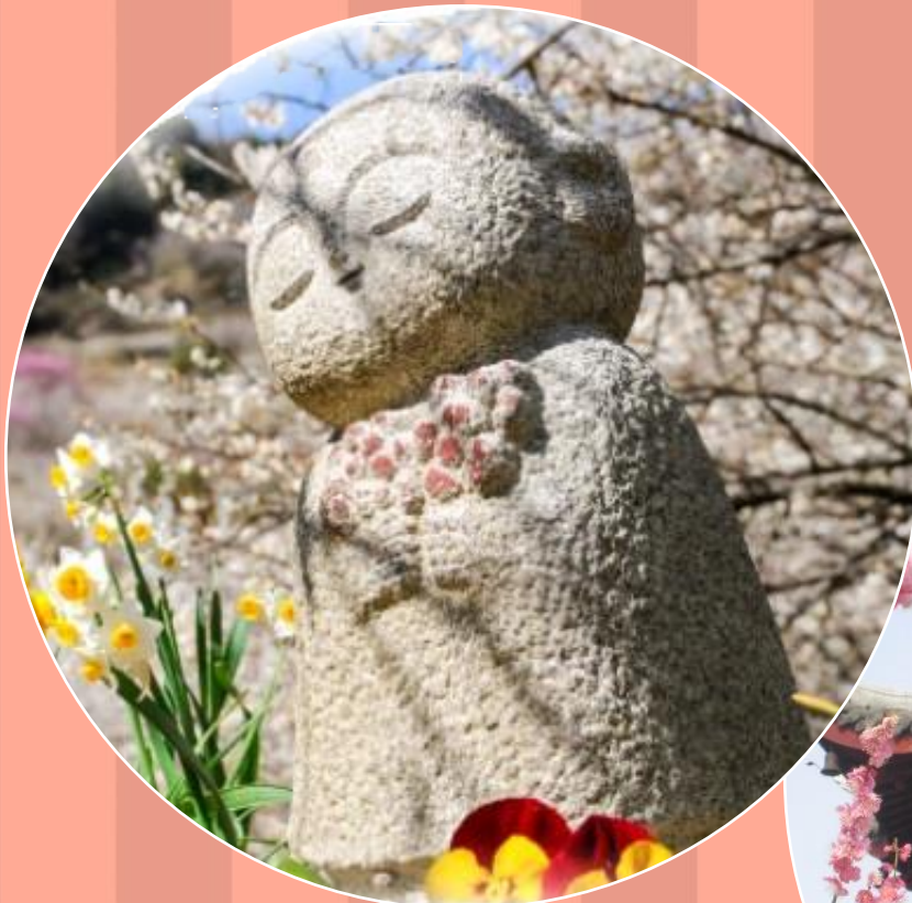
撮影場所：綾部山梅林 南入口正面