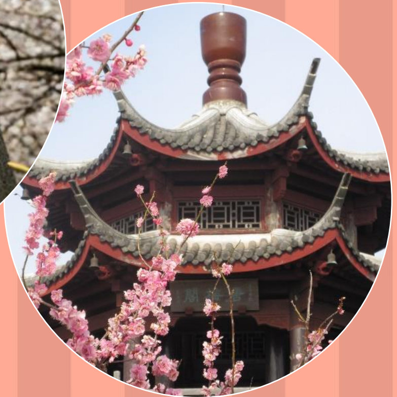
撮影場所：世界の梅公園 頂上北側 唐梅閣