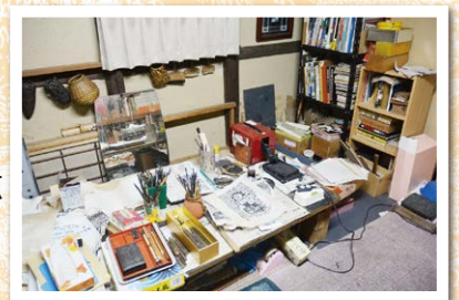
アトリエと愛用の道具