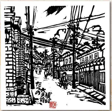
たつの大手前横町

たつの市出身の版画家乾太氏の追悼展を、霞城館、龍野歴史文化資料館、うすくち龍野醤油資料館の3館で開催します。