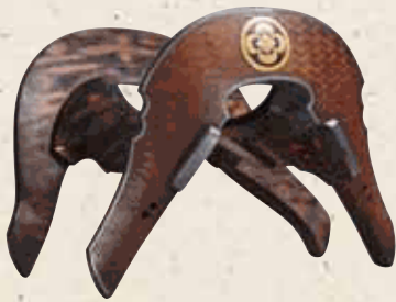
紗綾形文様木瓜紋入鞍（個人蔵）