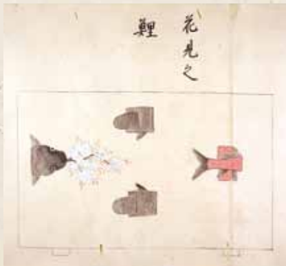
今も式庖丁の伝統を伝える生間流の免状 鯉切形之図 宝暦8(1758)年3月（個人蔵）