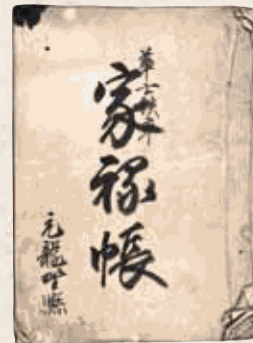
家禄帳 明治時代（個人蔵）