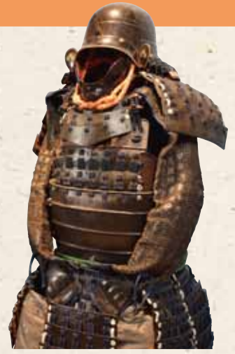
写真：村田家に伝わった資料 左から烏帽子形兜 伊達政宗書状 紫系威革包桶側胴具足

脇坂氏が龍野に入封してもうすぐ350年が経とうとしています。戦国時代から明治時代まで、家臣たちは主君と共に家の存続をかけた戦い、御用を勤めてきました。