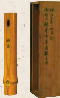
「此君」細花入（個人蔵）