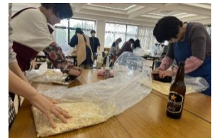
「手作り味噌づくり」の様子

パーソナルカラー、話し方&マナー、防災、たつの市歴史探訪 等の講演会 味噌づくり、体操、ワンプレートお節、お茶席入門 等の実技実習 給食センターの見学、ピアノ演奏会 令和6年度も多彩な分野の楽しい講演会・実技実習を計画しております!